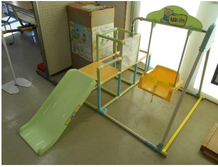
展示品番号:A-1 商品名: 子供用ジャングルジム 金額: 1,500円 当選番号:51番 補欠:32番