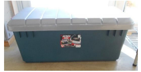
展示品番号:A-3 商品名: コンテナボックス 金額: 2,000円 当選番号:58番 補欠:19番