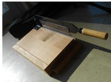
展示品番号:A-8 商品名: 麺切り機 金額: 2,000円 当選番号:95番 補欠:94番