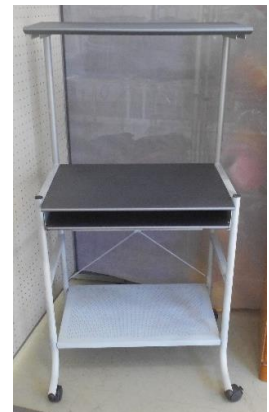
展示品番号:A-9 商品名: パソコンデスク 金額: 1,000円 当選番号:なし 補欠:なし