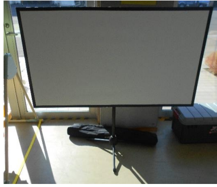
展示品番号:A-2 商品名: スクリーン 金額: 1,500円 当選番号:12番 補欠:20番