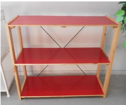
展示品番号:A-7 商品名: 木製シェルフ 金額: 1,500円 当選番号:30 補欠:なし