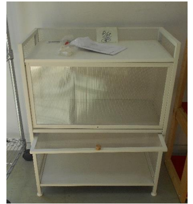
展示品番号:A-6 商品名: 扉付きシェルフ 金額: 1,500円 当選番号:38番 補欠:15番