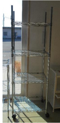
展示品番号:A-5 商品名: メタルラックB 金額: 2,500円 当選番号:1番 補欠:53番