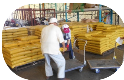
← 肥料販売会のようす

また、環境センター内にて、年に数回、肥料販売会やペットボトルキャップ・牛乳パック交換会、タイヤ・バッテリー引取会などのイベントも行い、地域交流を図っています。