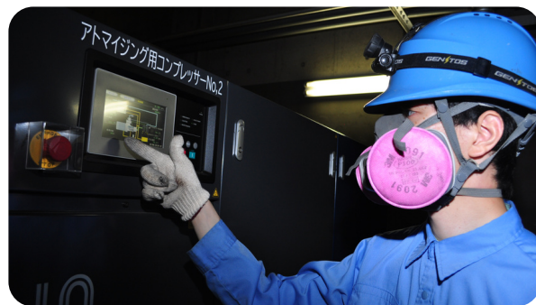
技術職 (電気又は機械)