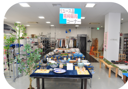
リユース品の展示販売