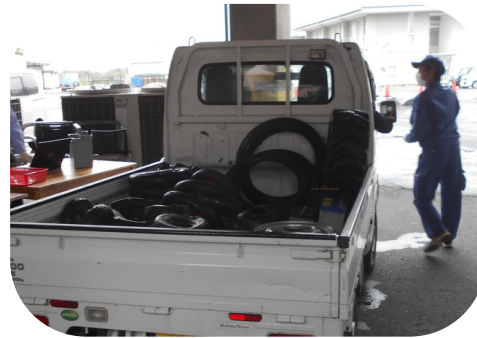
イベント（タイヤ・バッテリー引取会）