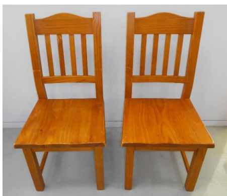
展示品番号:A-5 商品名: 椅子セット 金額: 1,500円 当選番号:57 補欠:4