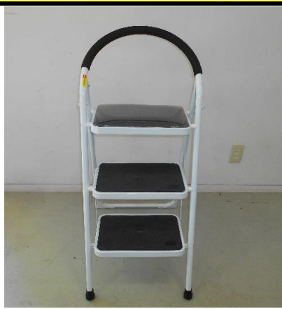
展示品番号:A-8 商品名: 脚立 金額: 1,500円 当選番号:36 補欠:14