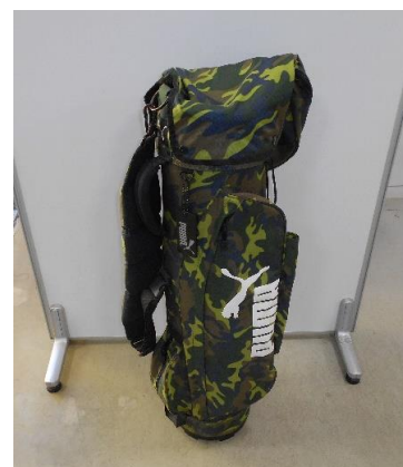
展示品番号:A-6 商品名: 筒形バッグ 金額: 2,000円 当選番号:42 補欠:20