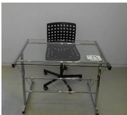
展示品番号:A-4 商品名: テーブル椅子セット 金額: 3,000円 当選番号:50 補欠:51