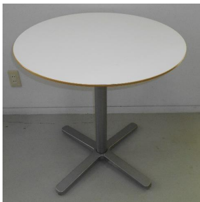
展示品番号:A-1 商品名: 丸型テーブル 金額: 2,000円 当選番号:なし 補欠:なし