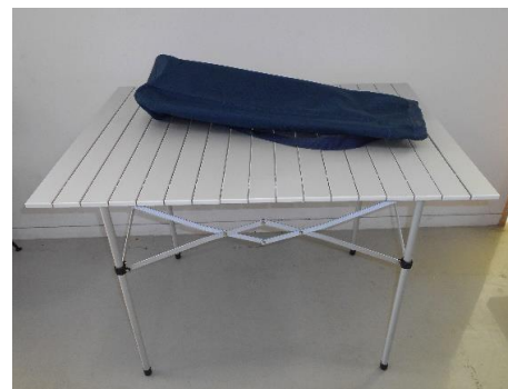
展示品番号:A-3 商品名: キャンピングテーブル 金額: 2,000円 当選番号:61 補欠:33