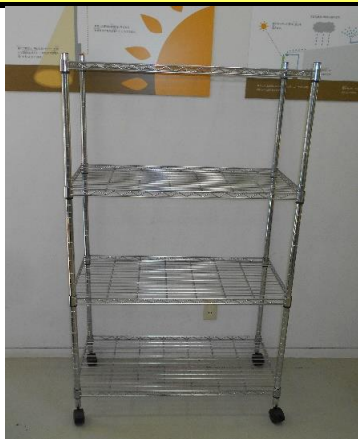
展示品番号:A-7 商品名: メタルラック 金額: 2,000円 当選番号:53 補欠:5