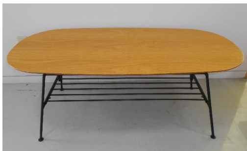
展示品番号:A-2 商品名: テーブル 金額: 1,500円 当選番号:なし 補欠:なし