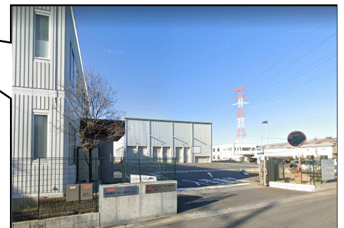
シナネンエコワーク(株) 入口