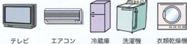
テレビ エアコン 冷蔵庫 洗濯機 衣類乾燥機

右の家電製品は、家電リサイクル法により取扱いができませんので、購入した店舗に引き取ってもらうか①～③のいずれかの方法で処分してください。