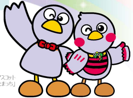
埼玉県のマスコット 「コバトン」「さいたまっち」